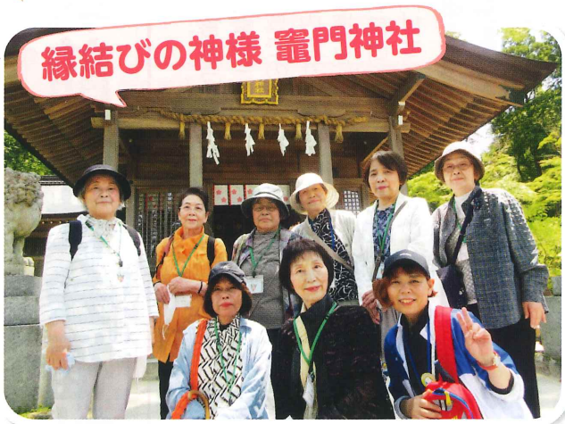
東小田上区サロン 野外活動