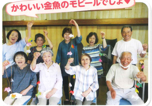
森山区サロン 創作活動