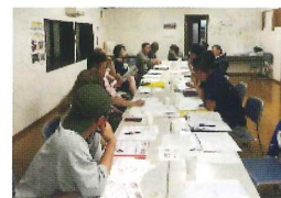
実行委員会の様子

↓ スマイルクラブ担い手説明会後に集まった人たちで実行委員会を立ち上げました。毎月1回実行委員会を開き、内容等の協議を行っています。