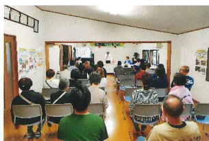
スマイルクラブ発会式

第2日曜日の9時から行っています。今年度は公民館開放、防災講座、料理教室、ウォーキングを予定しています。