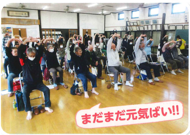
下高場区サロン 介護予防健診