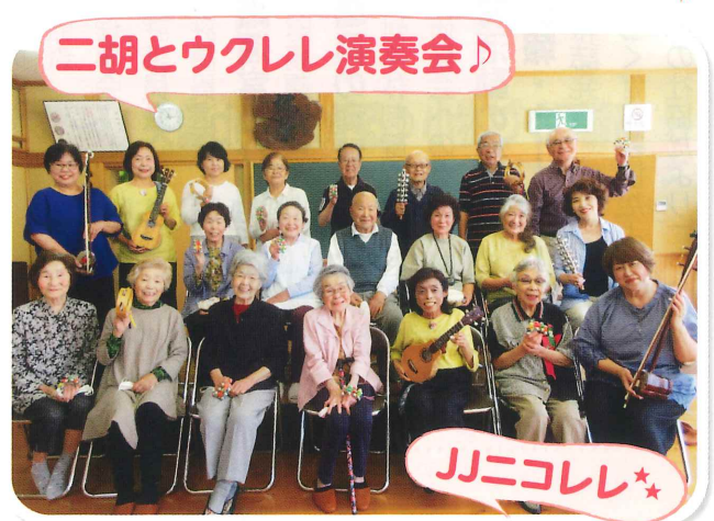
新町区サロン 独自活動